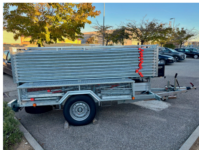
FIS REMORQUE UNI-SAFE OCTOBRE 2025