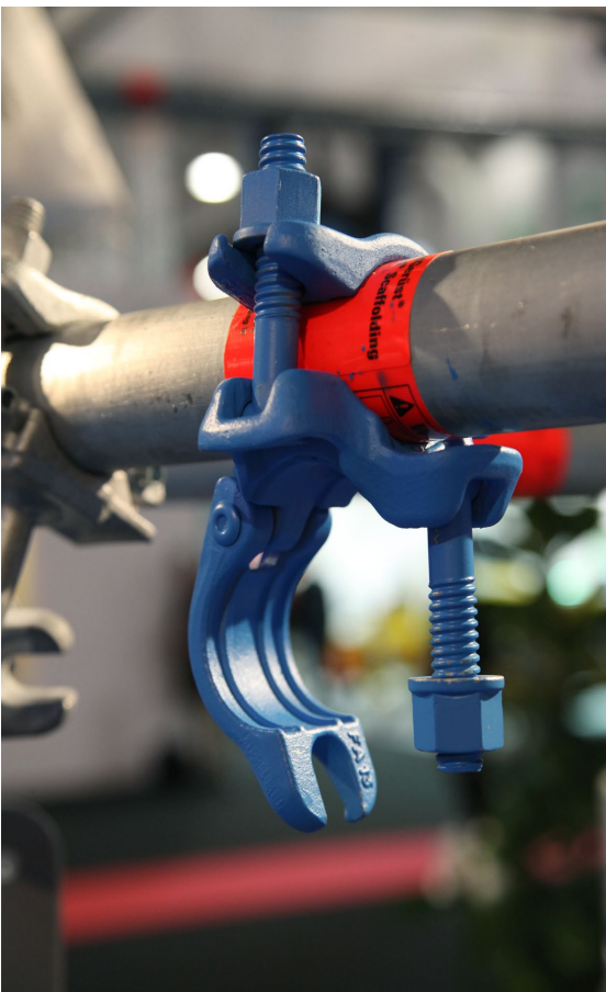
Collier orthogonal : réf 0781.405

La tenue au glissement est conservée par rapport aux filetages standards (910 daN - Classe BB suivant norme NF EN 74-1).