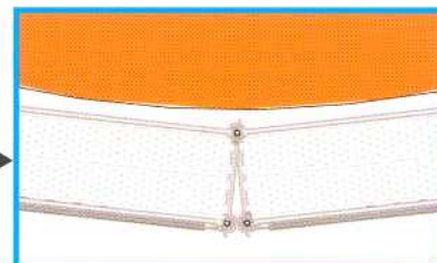
Avec le support plancher circulaire