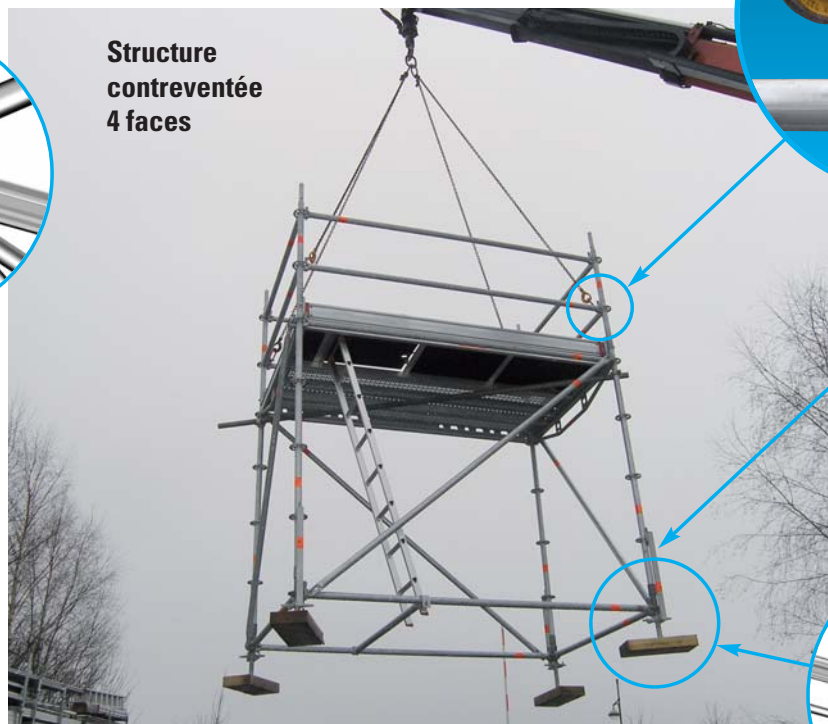
Structure contreventée 4 faces