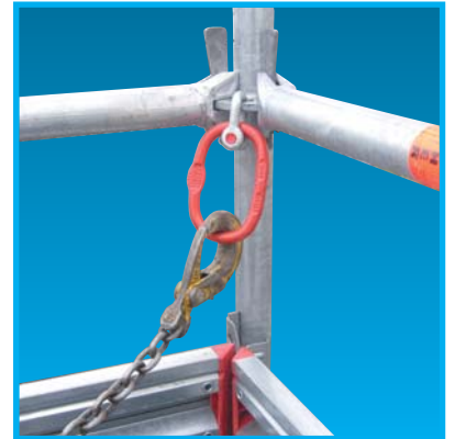
Accessoires de levage : anneau de levage (CMU : 1,6 T) + manille (CMU : 1,5 T), réf. : ANMA.000

Le levage devra être réalisé suivant les règles de l'art.